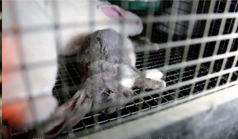
Image d'illustration ne provenant pas de l'élevage concerné.